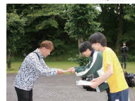
▲ スポーツ・ウェルネス特別賞(学祭)