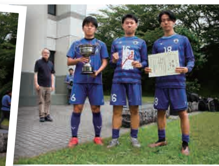
▲ サッカー第2ブロック優勝(O・J・I)