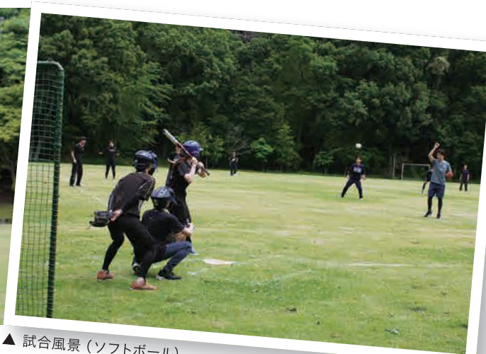
▲ 試合風景(ソフトボール)