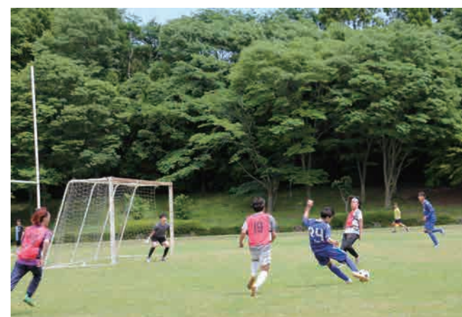
▲ 試合風景(サッカー)