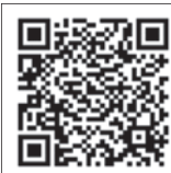
〈成城キャリアナビ〉