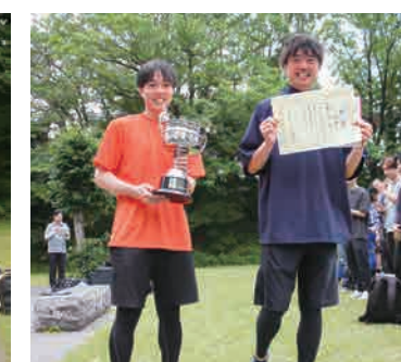
▲ ソフトボール優勝(教職員チーム)