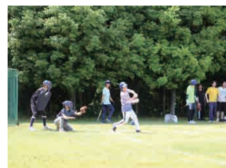
▲ 試合風景(ソフトボール)