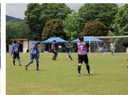
▲ 試合風景(サッカー)