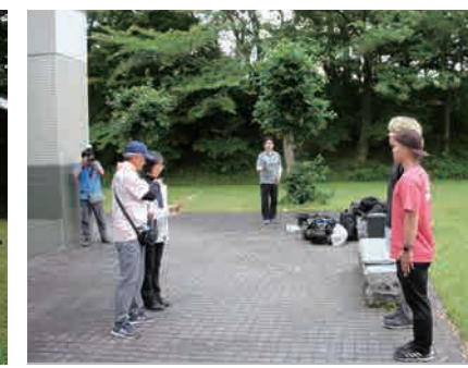
▲ 学生部長特別賞(コルカタ)