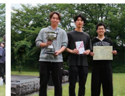
▲ 軟式野球優勝(Ratsへのリスペクト)