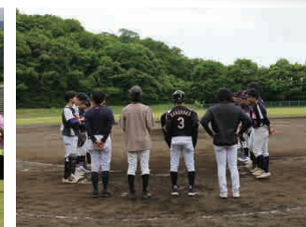
▲ 試合風景(軟式野球)