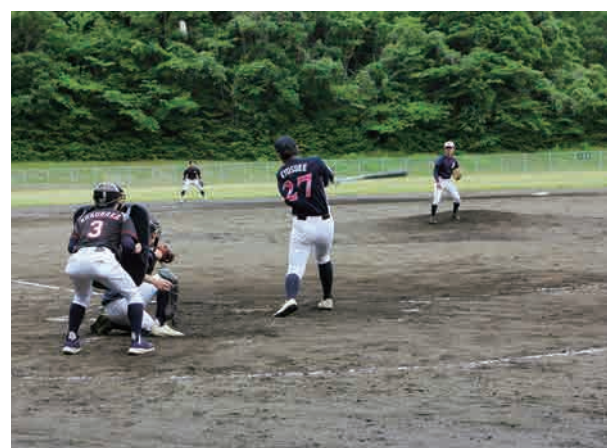
▲ 試合風景(軟式野球)