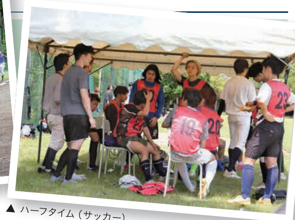
▲ ハーフタイム(サッカー)