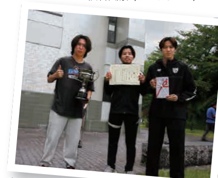
▲ サッカー第1ブロック優勝(クレイスティージャ成城)