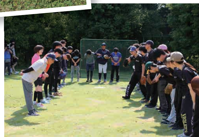
▲ 試合風景(ソフトボール:教職員対Violet's)