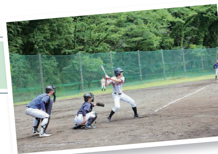
▲ 試合風景(軟式野球)