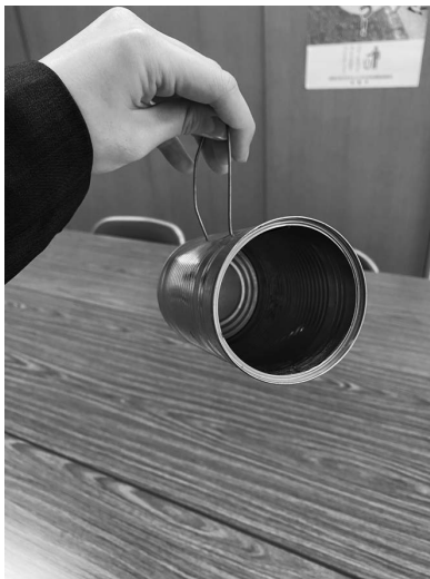
図2 カンテラ 八幡町会高氏による再現

年は、近隣の年長者に誘われて参加するのが通例であったという。その際、女子は浴衣または着物姿で飾りのついた提灯 17) を、男子は空き缶を加工した自作のカンテラ 18) を携行することが多かった(図2)(図3)。このカンテラは、毎年行事の前に子どもたちが集まって製作するものであった。その際、年長者が年少者へ作り方を伝えていたという。