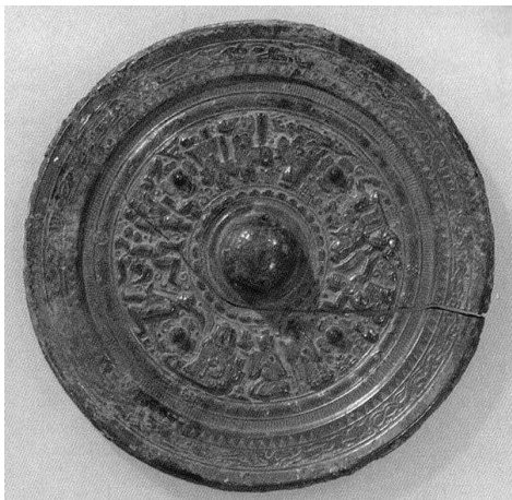
図3 亀塚古墳出土の尚方作神人歌舞画像鏡