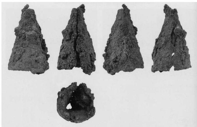
図6 宿屋敷西1号墳出土の鉄鐮 ※『新狛江市史普及版』より転載

これらの諸点からすれば、狛江地域には早くから渡来人が居住していたのではなからうか。彼らは馬匹生産や鍛冶生産に関与しており、そうした状況が背景にあつて、喜多見中通遺跡出土の固定式環状鏡板付轡や、宿屋敷西1号墳出土の鉄鐮がこの地にもたらされたと推察されるのである。宿屋敷西1号墳は石戸支群に含まれ、喜多見中通遺跡も岩戸支群の東に接していることからすると、渡来系の人々は狛江地域の中でも北西の岩戸支群付近に集住していたと見ることもできる。また、常陸国や武蔵国高麗郡との関係から、狛江地域の渡来人には高句麗に出自を持つ人々が多く含まれており、高麗郡設置以前から各地の高句麗系渡来人とネットワークを形成していたことがうかがえる。彼らは大型円墳に葬られたこの地域の首長層というよりも、