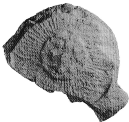
図5 弁財天池遺跡出土の単弁十六葉蓮華文軒丸瓦

とあり、常陸国をはじめとする計七カ国に居住していた高句麗系渡来人一七九九人が武藏国へ移され、高麗郡が設置された。この高麗郡の郡