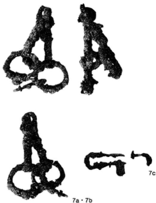
図4 喜多見中通南遺跡出土の鉄製固定式環状鏡板付轡

いるが、この遺跡から出土したものは関東地方で最古の五世紀中葉の年代を示しており、この時期に多摩川中流域で馬匹生産が始まっていた可能性が指摘されている ② 。これを踏まえて寺田良喜は、この喜多見中通南遺跡に居住していた人々は、近傍の土屋塚古墳を築造した母集団であり、彼らは「七世紀後半以降に本格化する」とされる朝鮮半島からの渡来人集団の東国移住の先駆け」であったとした。また、亀塚古墳には