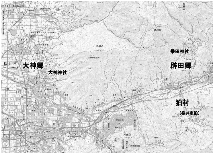
図10 大和国城上郡狛村周辺地図 ※地理院地図電子国土 web 掲載地図を一部加工して作成

とあり、白村江の戦いの際、三輪君根麻呂が中將軍に任命されて出征している。同様に、三輪君氏は海外へ派遣された人物を多く輩出している。 (66) また、三輪君氏が奉祭した大物主神は、『日本書紀』神功皇后撰政前紀（仲哀九年九月己卯条）に、 令 二 諸国 一 、集 二 船舶 一 練 二 兵甲 一 。 時軍卒難 レ 集。皇后曰、必神心焉、 則立 二 大三輪社 一 、以奉 二 刀矛 一 矣。 軍衆自聚。 とあり、神功皇后が新羅に出兵しようとした際に軍卒が集まらなかったため、大物主神を祭る社を建立して刀・矛を奉納したところ、多くの兵士が集まったとあるように、対外交渉に靈験を示