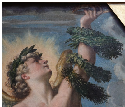
(図4a) 図4の作品の部分