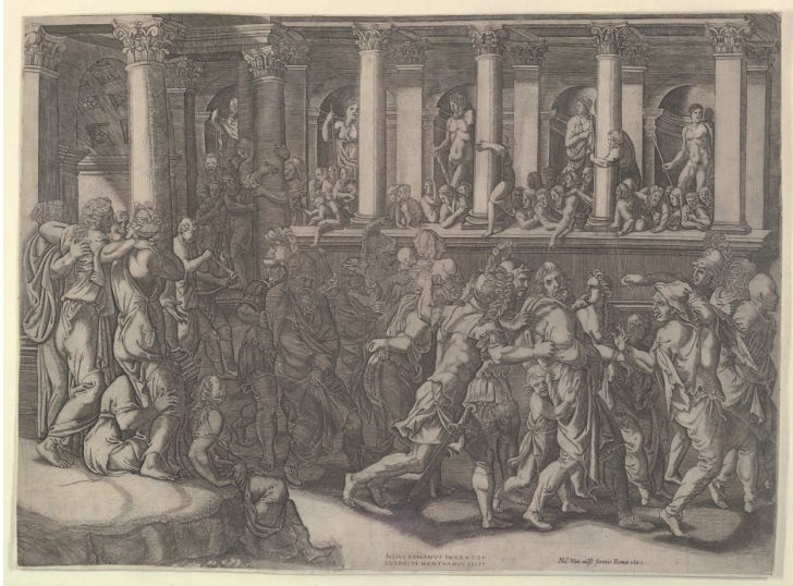
(図7) ジョルジョ・ギージ (ジュリオ・ロマーノの素描にもとづく)《捕虜たちの愚弄》 1540年頃、ニューヨーク、メトロポリタン美術館