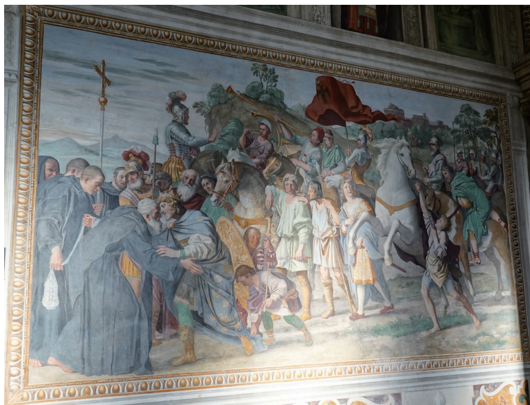
(図11) ドメニキーノ《聖ニルスと皇帝オットー三世の出会い》1608—1610年、グロッタフェッラータ修道院、創建聖人礼拝堂