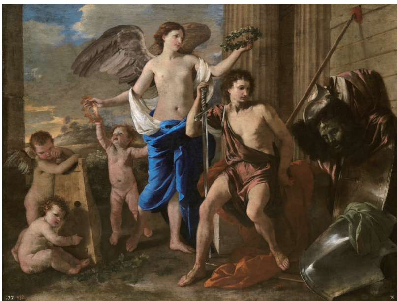
(図1) ニコラ・プッサン《ダヴィデの勝利》1630年代、マドリード、プラド美術館