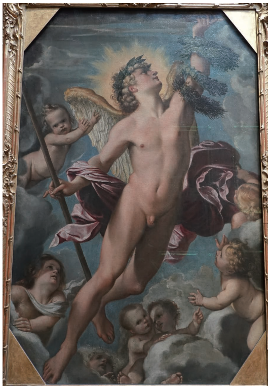
(図4) アンニーバレ・カラッチ《名誉のゲニウス》1588—1589年頃、ドレスデン国立古典 絵画館