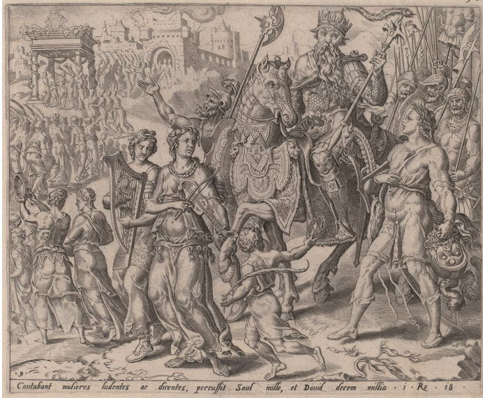
(図5) マールテン・ファン・ヘームスケルク (にもとづく)《サウルとダヴィデの凱旋》 1556年頃、ワシントン、ナショナル・ギャラリー