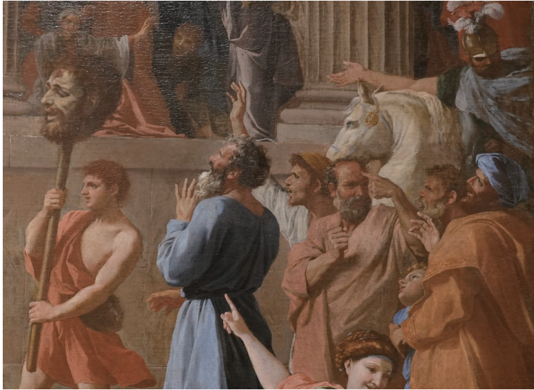
(図2a) 図2の作品の部分