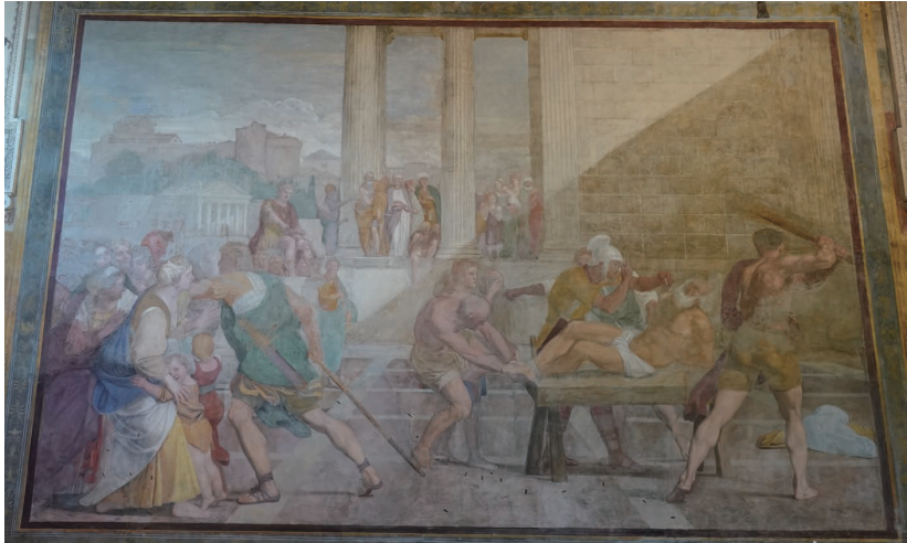
(図9) ドメニキーノ《聖アンデレの笞打ち》1608年、ローマ、サン・グレゴリオ・マリーニョ聖堂、サンタンドレア祈禱堂