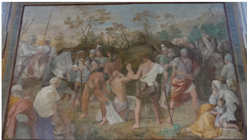
(図10) グイド・レーニ《殉教に導かれる聖アンデレ》1608年、ローマ、サン・グレゴリオ・マーニョ聖堂、サンタンドレア祈禱堂