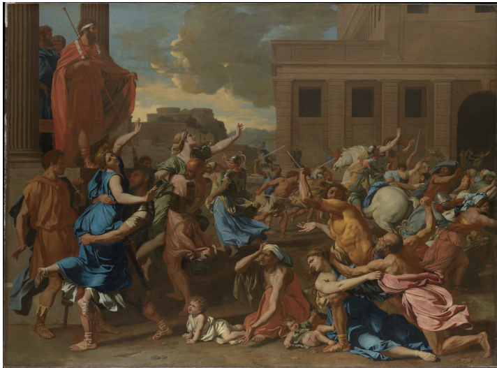
(図8) プッサン《サビニの女たちの掠奪》1633—1634年頃、ニューヨーク、メトロポリタン美術館