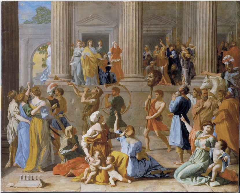
(图2) プッサン《ダヴィデの凱旋》1630年代、ロンドン、ダリッチ絵画館