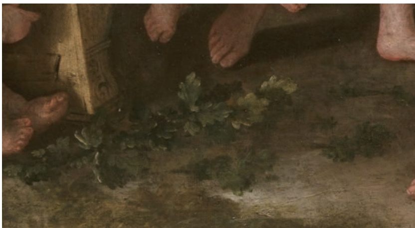
(図1a) 図1の作品の部分