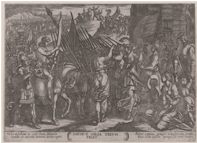
(図6) アントニオ・テンベスタ《ダヴィデの凱旋》(ニコラウス・ファン・アールスト刊 『旧約聖書の戦い』図17) 1590—1610年頃、ニューヨーク、メトロポリタン美術館