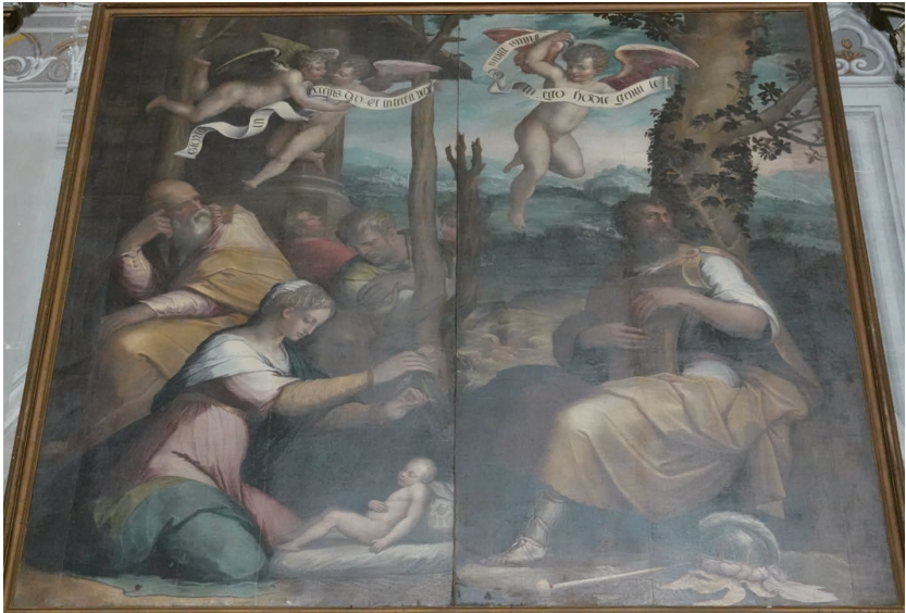
(図3) ジョルジョ・ヴァザーリ 《羊飼いたちの礼拝とその場で豎琴を奏するダヴィデ王》 1545—1546年、ナポリ大聖堂