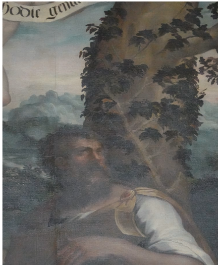
(図3a) 図3の作品の部分