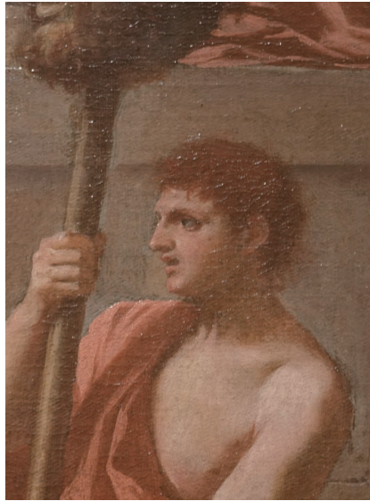
(図2b) 図2の作品の部分