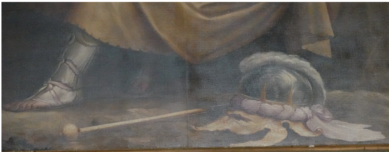
(図3b) 図3の作品の部分