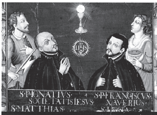
図6 「マリア十五玄義図」(部分) (京都大学総合博物館蔵)

先に触れた左側の図像は、砂時計や日時計に代表される現世的なものに執着した《アニマ》を描いていたが、右側の図像は、現世を嘆き、天