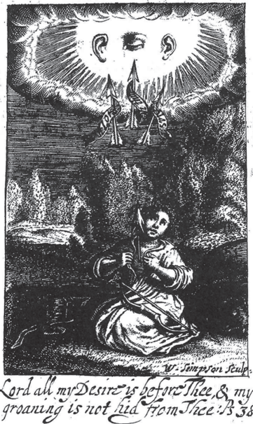
図5 Francis Quarles, Emblemes (1635), The Entertainment of Book 3.

さらに、この右にはクォールズの『エンブレム集』第3巻の冒頭に描かれている“Entertainment”、つまり第3巻全体の要旨を表した題扉というべき図像が彫られている。〔図5〕弓を膝に置き、矢が胸から天を指し、胸を開くポーズをとってひざまずいている《アニマ》の頭上に、目と耳があり、そして3本の矢が先を上に向けて描かれている。空中に描かれた目と耳は、遍在する神を表象している。3本の矢には、それぞれ“Gemitas”（嘆く）、“Vota”（誓う）、“Suspiria”（後悔する）と記されている。出典であるフーゴでは、“Ah!”, “utinam”, “Heu”とあり、クォールズに対応している。矢の下にみ