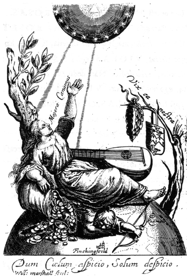
図1 Francis Quarles, Emblemes , The Invocation

3行目の「高貴なテオルボ」とは、ドリア旋法のことで、教会旋法のもっとも主要なものである。プラトンが『国家』で推奨した高雅で荘重な音階であるが、それよりも「天上的栓を4音階高く締め上げよ」と、より高い調べを奏でようとしている。つまり、彼のエンブレムの詩文はテオルボで歌われる以上に天上的なものであり、エンブレムを読むことは、教会で聖歌を聞くに等しいディヴォーションナルな行為であることを示唆している。そして、タイトル・ページの図版には詩人の魂を表すミュースが、大型のリュートであるテオルボを持って天に向かって歌っている。〔図1〕右側にあるのは地上的な名誉と世俗詩、左側にある青葉を茂らした木は宗教詩を表し、