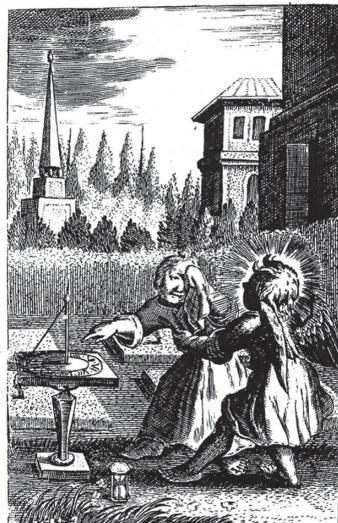
Are not my dayes few? Cease then, and let me alone that I may bewayle me a little. Job . 30 . 20 . will. jones . sculpsit