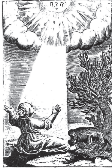
図8 Francis Quarles, Emblemes , 5:14 (1639)

How amiable are thy Tabernacles O Lord of Hosts, my Soule longeth, yea euert sainteth for the courts of the Lord. Wilt. Marshall. Sculp.