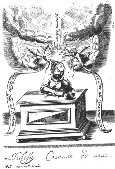
図 7-1 Francis Quarles, Emblemes , The Farewell.

また、墓石の東面に彫られているのは、クォールズの『エンブレム集』の最後に描かれた図像である。〔図 7-1〕図 7 は、クォールズの数少ない出典のないエンブレムである。中央のパネルの両側には、石工の使う道具類が彫られており、その中央には石の祭壇で本を開く《アニマ》が描かれている。彼女は肩肘をついて、片手は球体におかされている。そして、2人の天使が彼女の頭上に冠をかざしていると同時に、2人が手にしたスクロールが左右に垂れさがっている。左の方のスクロールは、“Sis fidelis usque ad Mortem”、右のほうのには、“et dabo tibi Coronam vitae”と彫られている。これらは、クォールズの銘文、“Be thou faithful unto death, and I will give thee the crowne of life”（「死に至るまで忠実であれ。そうすれば、あなたに命の冠を授けよう」という、「黙示録」2：10からの引用句である。この図像は、“Farewell”と記された向かい