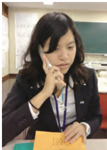
第62回四大学運動競技大会副実行委員長