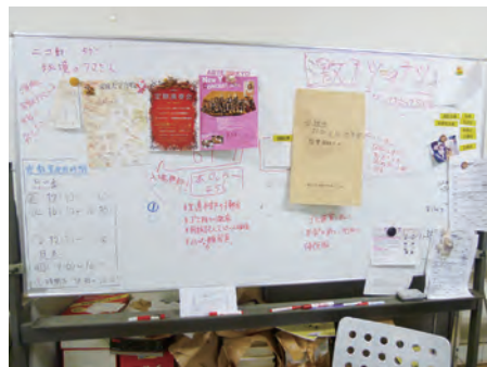
各局の情報を共有しているホワイトボード

最後になりますが、協力して下さいました皆様、繰り返しになりますが、本当にありがとうございました。