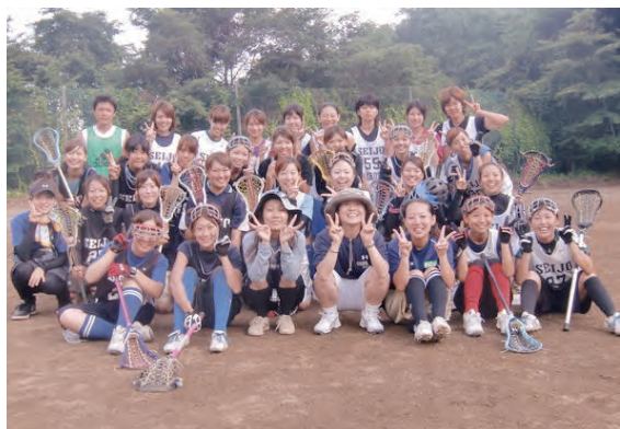
夏合宿にて（山中湖）