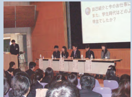
今年度のOB・OG懇談会にて②

今後は学内外問わず多くの企業説明会や合同セミナーが開催されます。学業との両立に困難を感じる時もあるかもしれませんが、効率よく情報収集が出来るように、今から計画を立てておきましょう。