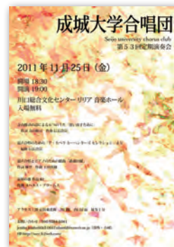
定期演奏会 (合唱団)