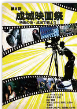
映画祭 (映画研究部)