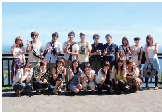
夏合宿にて（伊豆下田）

はじめまして。僕らは成城旅行部、通称たび部です。旅行をするだけと聞くと単なるサークルかと思われがちですが、一応ちゃんとした部活団体です。現在私たちは部員数約35名程度で不定期ではありますが、火、木のお昼に部会を開いて次はどこに行くかななどの話し合いを行っています。おおまかに説明すると旅行部では、大学生特有の長期休暇を利用して各地を旅行するという名前の通りの活動をしています。近年では旅行する範囲が関東、甲信越など中心になっていてなかなか遠くまで行けていませんが、部室にある十年くらい前の先輩方の旅行アルバムなどを見ていると、当時は海外などにも頻りに旅行をしていたという実績があるほどアクティブな団体でもありました（笑）なかなか全員がそろって旅行に行くというのは難しいですが、旅行部に入っている部員はさすがに旅行部という名前のついている団体に入ってくるだけあって、それぞれが旅行好きで海外にもよく行くという人も結構多いです。それぞれ撮りあってきた写真なども活動の記録として年に一回の文化祭で内模擬の展示として発表しています。なかなか運動部のように何か一つの目標に向かって活動していくというのが難しい団体ではありますが、これからはより多くより遠くに行けるよう今まで以上にアクティブに活動していきたいと思います。