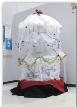
クリスマス展示 (美術部)