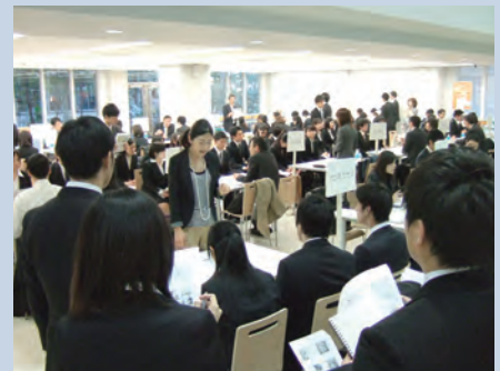
昨年度の学内合同企業セミナー

なお、参加希望者は、当日、直接会場にお越しください。時間内の入退場は自由です。事前予約の必要はありません。ぜひ積極的にご参加ください。