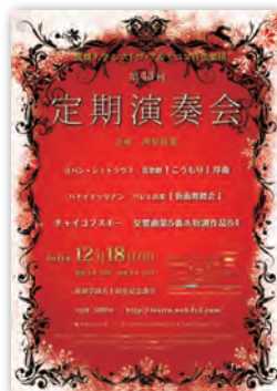
定期演奏会 (レストロ・アルモニコ管弦楽団)