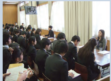
今年度のOB・OG懇談会にて①

知らない業界を研究するには、きっかけがないと、なかなか関心もてないものです。そこで、キャリア支援部では、広い視野を持って、幅広く仕事や業界・企業に目を向け、自身の可能性をさらに広げてもらえるよう、様々なイベントを開催しています。11月には社会人との「本音のコミュニケーション」を通して、「働くこと」の意味を身近に感じてもらえる「OB・OG懇談会」を、12月には、様々な業界を知るき