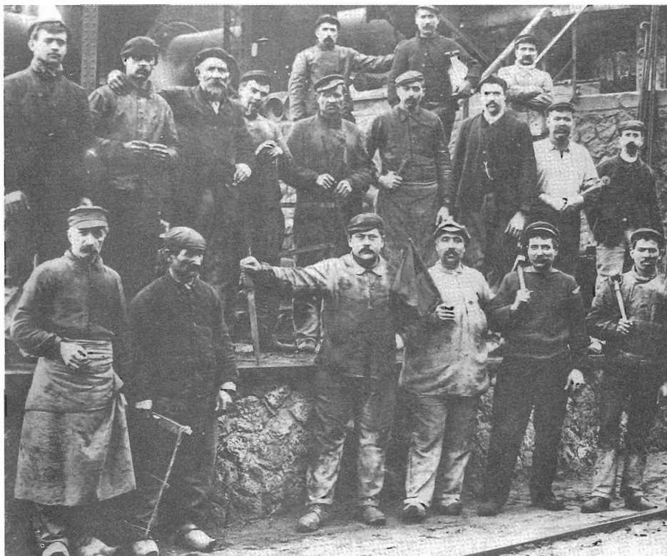
図2 ロレーヌ鉄鋼業の高炉労働者たち（20世紀初頭）

めに「スープ・コミュニスト」 soupe communiste と呼ばれる炊き出しを行いつつ、他方で坑夫の窮状を「給与明細書」を明らかにしつつ世間に訴えた。[大森弘喜, 1996, p200] 14) この過程でメレイムらの尽力により「ムルテ・モゼル坑夫組合会議」が組織された。