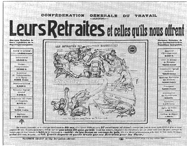
図6 労働者退職年金制に反対を訴える CGT のポスター（1900 年頃） 頭書きには「彼らの年金そして彼らが我々に与える年金」とある。