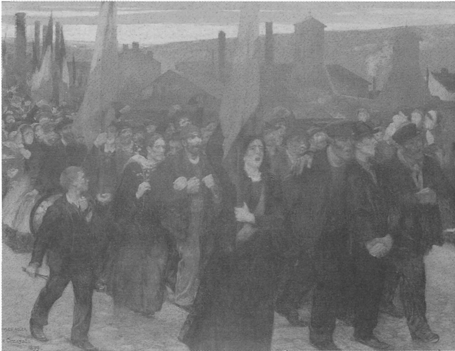
図7 1899年ル・クルーズのストで街をデモする労働者と婦人・少年たち、 彼らの掲げているものは赤旗ではなく、三色旗である。

求したが [M.Perrot, 1995, p311-313], 本稿のテーマに即して云えば、彼らがすぐに公権力の介入を求めたことが注目される。会社が彼らとの交渉を拒むと直ぐに、彼らはパリまでの集団行進を準備し、中央政府に労働者の窮状を訴え介入を仰ごうとした。