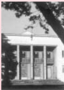
大学講堂（2号館の前身）

このほか、短期大学部史の編纂や、紀要の記念号の出版、それから再来年3月の最後の短大生卒業のさいには、卒業全員を招待するホームカミングデーの開催が予定されています。