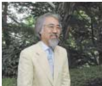
2号館脇の大樹の下で