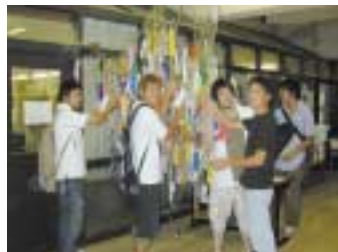
鈴なりの願い。男子も大喜び!

「夏の風情を楽しみながら、自分の願いや想いを短冊に綴って七夕飾りに託してみませんか？」という学生相談室の呼びかけで、6月25日から7月7日までの間、3号館1階に笹が立ちました。自分の願いを真剣に考える人、物欲しか浮かばない～いと叫んでいる人、人知れず笹に想いを結んでいる人、人の願いに興味を持っている人…、願いは様々、楽しみ方もそれぞれでしたが、最終日には、短冊を結ぶ場所がないほどで、願いの重みで笹はしなっていました。季節を楽しみつつ自分の願いを考えてみる、字に表してみるというこの企画、来年は何を書こうかなという声も聞かれ、大好評でした。