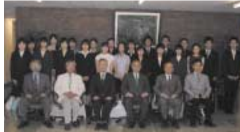
表彰式後、表彰状を胸に記念撮影