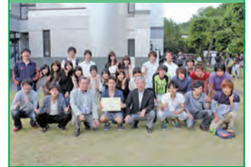
サッカー 準優勝 FC CARIOCA