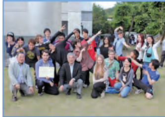
学生部長賞 チームよくできました