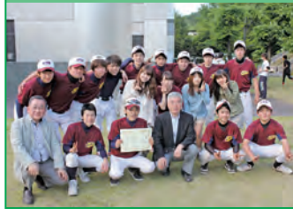
軟式野球 準優勝 HTO