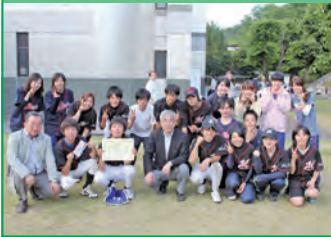
ソフトボール 準優勝 Mix Bonds