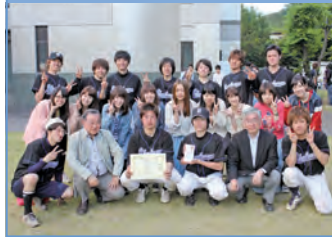
体育科特別賞 厚生ブルーベリーズ