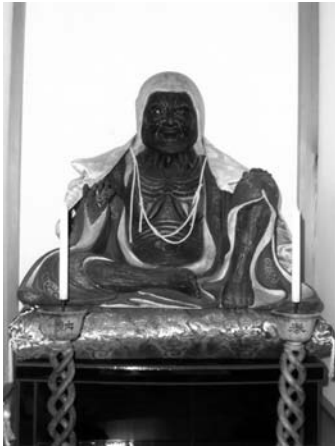
写真1：誓願寺の小町像

○老婆 慈覚ノ作ト云縁起ニ曰誓願寺開山文国上人太 和巡リノ際靈夢ニ仍テ小松寺ニ安置シアルニ乞ヒ求メ秋 田ニ下リタリ土崎湊幻見庵ニ其嫗像ノ写シ左ノ如シ。名 勝誌曰 該寺ハ慶長十年八月佐竹義宣ノ建立スル処ニシ テ僧文閻ヲ以テ開山トシ、浄土宗ニシテ、春日運慶作ノ