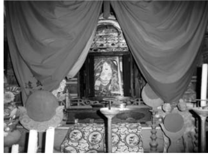
写真4：正乗寺の奪衣館（上）と 優婆明王（下）

「諸人や たえず詣での藤崎に みちびき給え むらさきの雲」と刻まれている。 山門をくぐると右手に鎮守堂、左手に奪衣館があり、さらに階段を上ると仁王門に行き当たり、本堂へと通ずる。先の『秋田のお寺』の記述と異なり、十王堂ではなく奪衣館に「藤崎の優婆様」が祀られているのである。もちろん閻魔をはじめとする十王と十牀地蔵も並置され、かつてはもう一牀地蔵尊が祀られていたが、これは平成八年（一九九六）に本堂廊下の一面に移祀された。その経緯について「南無地藏願王菩薩尊像遷座由来」には、次のように記されている。