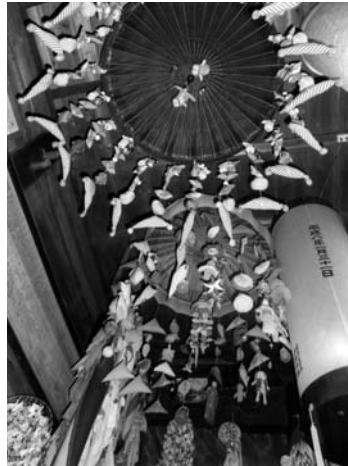
写真5：奪衣館内に吊られたカサボコ

れたことが知られる。ここではかつて十王堂、あるいは奪衣館に安置されていた地蔵が、寛政元年に造像されたものであることを確認しておきたい。またこの由来書によって、通称「藤崎の優婆様」が優婆明王と呼ばれ、また祀られているお堂の名称も優婆明王堂であることがわかる。しかし、昭和十二年（一九三七）に屋根瓦の葺き替えが行われたとされるこの堂には、現在「奪衣館」なる扁