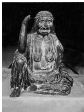
写真2：旧専光寺の小町自刻の像