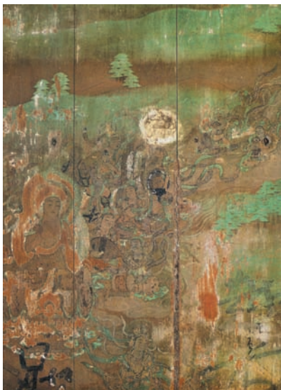
図 15 平等院鳳凰堂壁画（下品上生図）