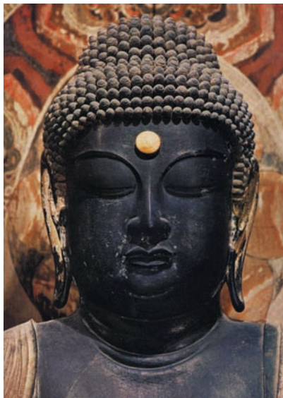
图 9 室生寺釈迦如来像 面部