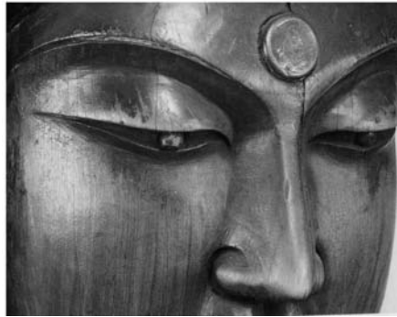
図6 清涼寺釈迦如来像 白毫相