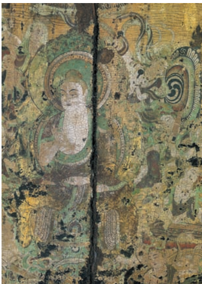
图 12 平等院凤凰堂壁画（中品中生图）