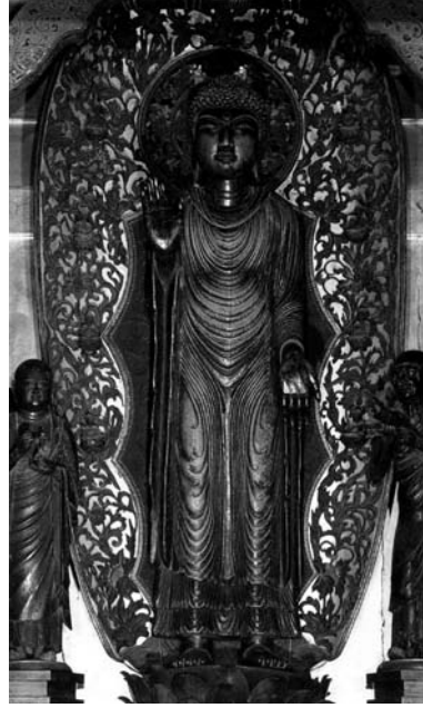
図5 清涼寺釈迦如来像