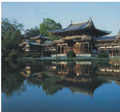
图 10 平等院凤凰堂