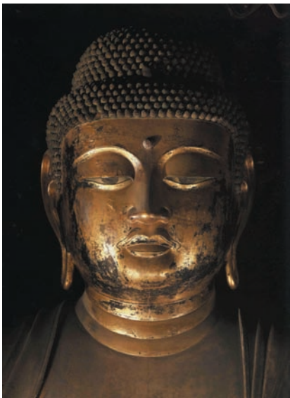
图 11 平等院阿弥陀如来像 面部