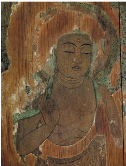
図 13 平等院鳳凰堂壁画（下品上生図）