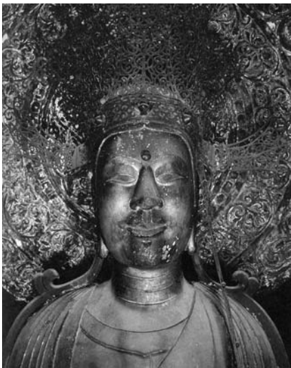
图3 法隆寺夢殿救世觀音菩薩像 面部