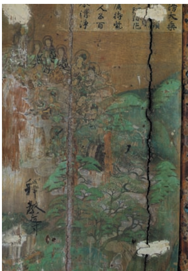
図 16 平等院鳳凰堂壁画（上品下生図）