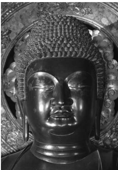
图4 薬師寺金堂薬師如来像 面部