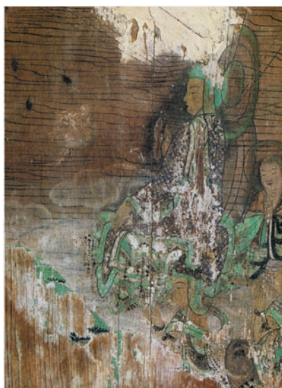
図 14 平等院鳳凰堂壁画（上品下生図）