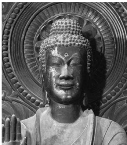
图2 法隆寺金堂釈迦如来像 面部