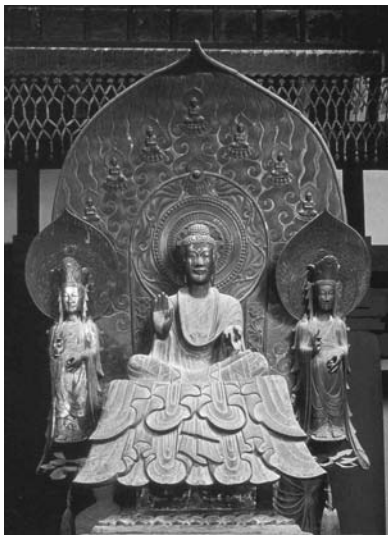
图1 法隆寺金堂釈迦三尊像