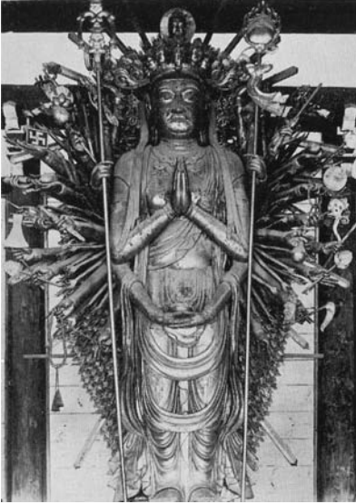
図7 東寺千手観音菩薩像