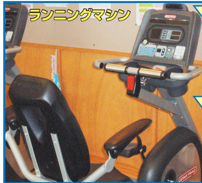
ランニングマシン