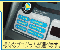
様々なプログラムが選べます。