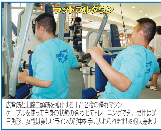
ラットプルダウン

ハムストリングス(大腿部裏側)を強化するマシン。肉離れを起こしやすい部位なので、怪我のリハビリや予防に役立ちます。