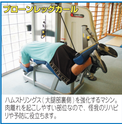
プローンレッグカール

まず、マシンジム講習を受講する必要があります。 これは安全かつ効果的なトレーニングをおこなう為に施設の利用方法、注意事項を覚えてもらう事が目的です。 講習の時間は約1時間(1回あたり3~5人まで)トレセンスタッフが皆さんの話を聞きながら講習を進めていくので安心して受講できます。 ※事前予約制・トレセン窓口にて受講日時を相談してください。 ※当日・電話予約不可