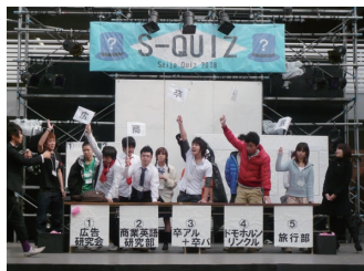
【S-QUIZ 中庭ステージにて】

学内からの有志が集まり、団体PRをかけて戦いました。箱の中身当て・サビトロ・お絵かきクイズを行い、お客様参加クイズで会場は大盛り上がりでした。