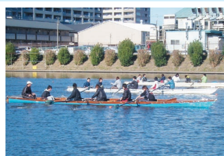
ゴール直前での熾烈な順位争い。最後まで勝者の行方がわからず選手も応援も夢中になっていました。