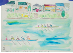
画：清水眞澄学長('07作)

12月7日(日)、埼玉県戸田オリンピックボートコースに於いて、体育部連合会主催・漕艇部後援の「第47回成城レガッタ」が開催されました。今年は30チームが