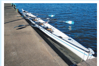
楽しい一日でした・・・