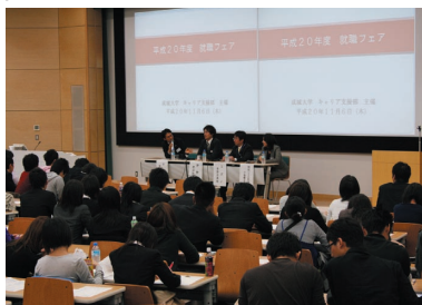
今年度の「就職フェア」

これから学外でも多くの企業説明会や合同セミナーが開催されます。本来の学業との両立に困難を感じる時もあるかもしれませんが、効率よく情報収集が出来るように、今から実行計画を立てておきましょう。