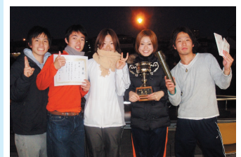
混合の部優勝 (ぼんぼん)