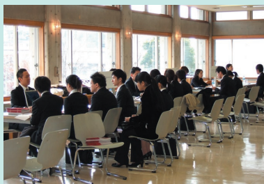
昨年度の学内合同企業セミナー

なお、 参加希望者は、当日、直接会場にお越しください。時間内の入退場は自由です。事前予約は必要ありません。 ぜひ積極的にご参加ください。