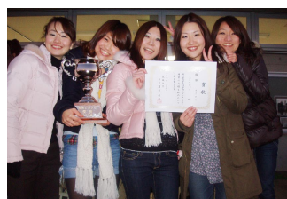
女子の部優勝 (プリジュリ)