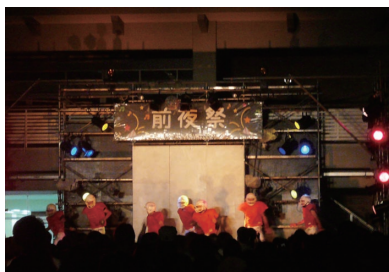
【前夜祭 中庭ステージにて】