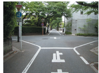
隅切りのある十字路

皆さんは、こうして開発された場所に毎日通っているのです。そして先人たちの思いは、ごく身近な所にも残されています。成城の真っ直ぐとした幅の広い道は、決して偶然に作られたものではありません。またキャンパスを出て住宅街（特に六丁目）や商店街を歩く機会があれば、車が来ていないか立ち止まるついでに、十字路で少しだけ注意深くみて下さい。そうすると至る所で、四つ角の直角の部分が切り取られた形になっていることに気がつくはずで、これは「隅切り」といって、車などとの出会い頭の衝突から子供たちを守るために開発当初からなされていた配慮でした。