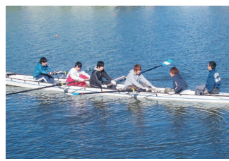
二戦目なのでメンバーの息もだいふ合っていました。この調子で優勝狙います！