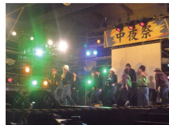
【中夜祭 中庭ステージにて】

今年度の中夜祭は、DJによるクラブをイメージしたイベントを行いました。DJ・ダンス・バンドのコラボレーションではステージはたくさんの人で埋め尽くされました。