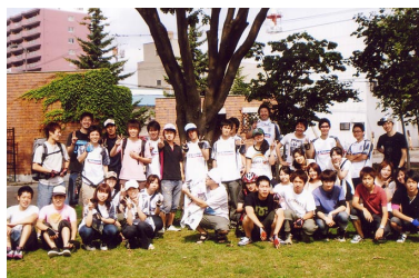
2008夏合宿 in 北海道