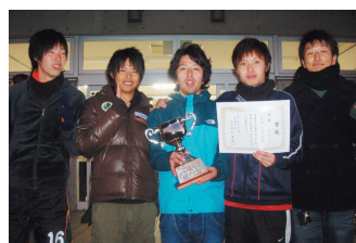
男子の部優勝 (オンズ・エトワール)