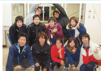
今回の大会を精一杯運営してくれた漕艇部の皆さん、皆さんのお蔭でホントに楽しい一日を過ごせました。お疲れ様でした！