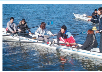
初めてのボート体験でも大丈夫！漕艇部員が親切・丁寧に教えてくれます。回数を重ねる度に上手くなります。