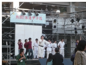
【熱闘！体連甲子園 中庭ステージにて】

体育部系の部活が各団体の活動のPRと体育にちなんだ競技を行いました。また、BMXチームniddさんによる素晴らしいバイクパフォーマンスに興奮は止まりませんでした。