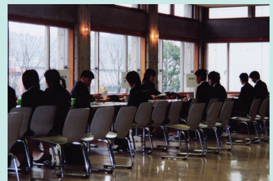
昨年度の学内合同企業セミナー

なお、 参加希望者は、当日、直接会場にお越しください。 時間内の人退場は自由です。 事前予約は必要ありません。 面接の練習にもなりますので、積極的にご参加ください。