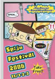
[大学パンフレット] [学園パンフレット]