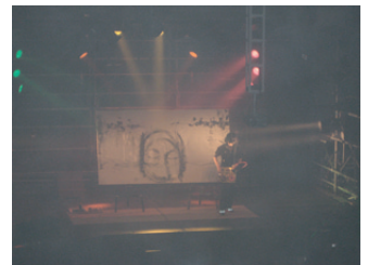
[ 後夜祭 002教室にて ]

成城祭最後の夜を飾ったイベント、後夜祭。やはり、トリを飾るイベントというだけあって、満員御礼につき、入場制限がしかれていました。また、ダブルダッチやリズムペインティング、軽音楽部やダンス部などの様々な公演が行われ、観客は成城祭最後の夜をたっぴりと堪能していました。