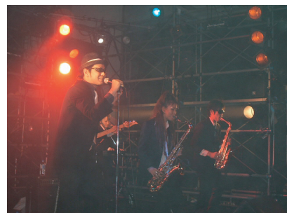
[ 中夜祭出演のEmpty Black Box ]