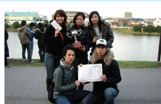
混合優勝: よせあつめ