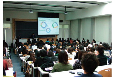
業界・企業研究セミナーは熱心な学生で大入りです。(今年度参加企業は次頁参照)

これから学外でも多くの企業説明会や合同セミナーが開催されます。本来の学業との両立に困難を感じる時もあるかもしれませんが、効率よく情報収集が出来るように、今から実行計画を立てておきましょう。