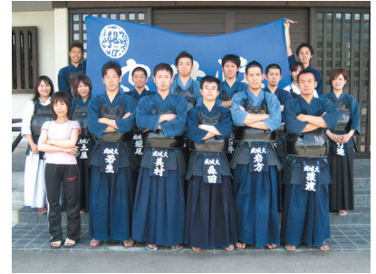
夏合宿・福島県伊南武道館にて

このように、我々剣道部は日々活動しています。練習は、月・水曜日は文連クラブハウス下の大学道場で、火・金曜日は中学体育館で行っています。このような勝負の世界に興味のある方は是非一度見学にいらして下さい。部員一同心よりお待ちしております。