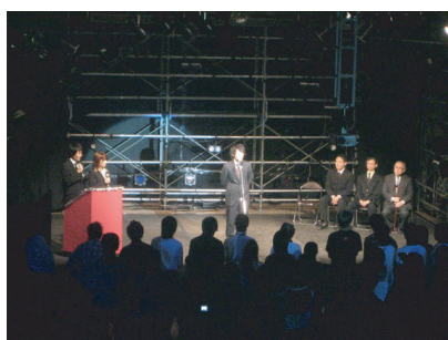
[ 開会式 002教室にて ]