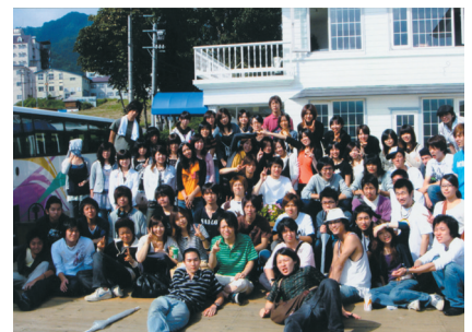
夏合宿にて全員集合

このようにもりだくさん部活でございます。笑いあり、怒りあり、涙あり、恋愛あり、人間の全ての感情がこの部活にはある気がします。楽しいことばかりではありませんが、それがまた部への愛着を生み、みんなの帰れる場所となっているのではないでしょうか。