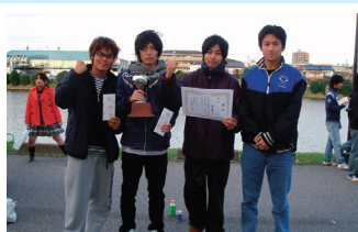
男子優勝: チーム体連

スタートラインに行くまでが唯一の練習! コックスの掛け声のもと、メンバーの息を合わせます。