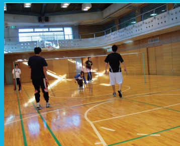
バドミントンの授業。仲間が揃えばフリーでも楽しめる。