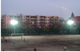
夜間活動中の様子

夏季休暇中に第一グラウンド照明灯の新設工事がおこなわれ、9月25日(月)の開講日より使用が可能になりました。