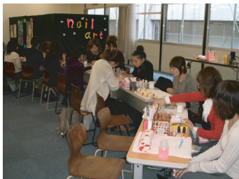
[ネイルアート 特21教室にて]