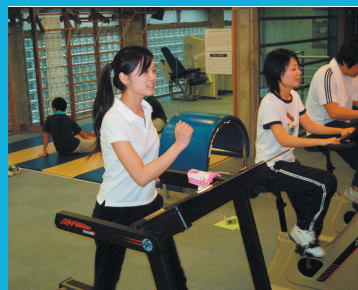
ランニングマシンでトレーニング中の学生

この他にも、競技力向上を目的とした種目ごとのプログラムやケガをしている人のためのリハビリテーション・プログラム、プールプログラムなど、個々人の目的・状況に合わせたプログラムの作成についての相談にも応じています。