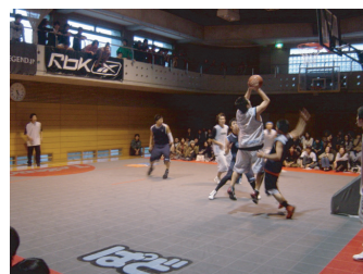
[ Legend公演 トレセンにて ]

2日目に行われたのは、日本初のストリートボールリーグ「Legend」の公演。彼らの圧倒的なパフォーマンスに観客は酔いしれていました。また、最前列の客席はコートから1mも離れておらず、観客とプレーヤーに一体感が生まれ、トレーニングセンターが熱気に包まれました。