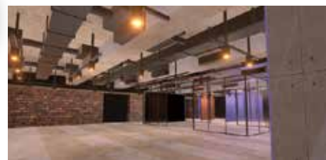
▲現在のVR空間(成城大学8号館にあるLounge#08を再現)

また、当初は再現を忠実にやる事を目標としておりましたが、現在では空間の利用者に対してストレスなく、快適に過ごせるような寸法やツールの設置を実施しました。