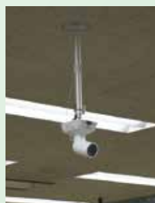
▲配信用 web カメラ