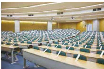
▲シールを貼った席は着席不可とし、ソーシャルディスタンスを確保

2021年度の授業については、受講者数が多い講義形式の授業科目については、遠隔授業の方法により、また、演習・ゼミ、語学、実習などの授業科目については、面接（対面）授業の方法により、それぞれ実施しています。