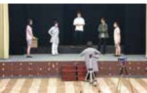
▲久しぶりの舞台。ビデオカメラの他、スマートフォンでも録画。