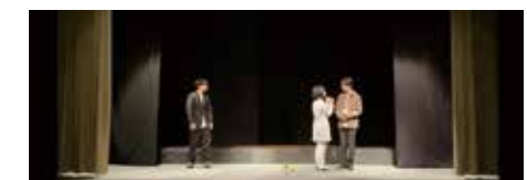
▲公演の様子。録画したものをZOOMで配信。