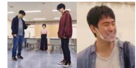
▲練習から演者はマウスシールドを装着。

今後の感染状況にもよりますが、7月に公演を企画しています。またオンラインでの配信を予定しており、是非皆さんにご覧いただければと思います。