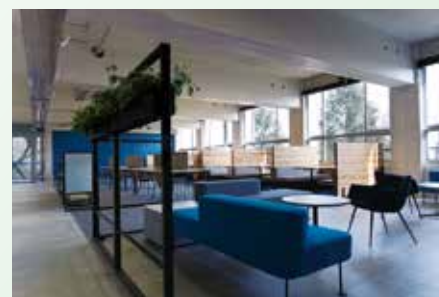
▲9号館に新設したラーニングスタジオでも受講できます