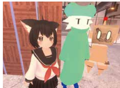
▲オンライン六月祭にてレイアウトを相談した際に撮影。アバターをVRで操作する事により円滑に配置を決定できた他、スマホでも利用できる事により参加に対するコストを軽減したとのこと。