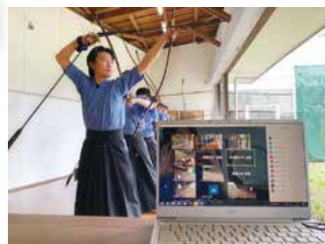
▲オンラインでの試合の様子