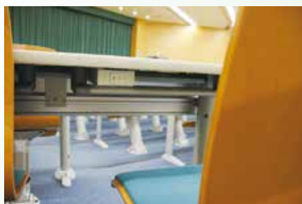
▲各席にコンセントを整備。PCの充電に使用ができます（003教室）

また、大学の全教室に Web カメラならびに専用の集音マイク等を配備・設置し、ハイフレックス型授業（面接授業を実施しつつ同時に遠隔配信が可能）に対応できるよう設備を充実させました。