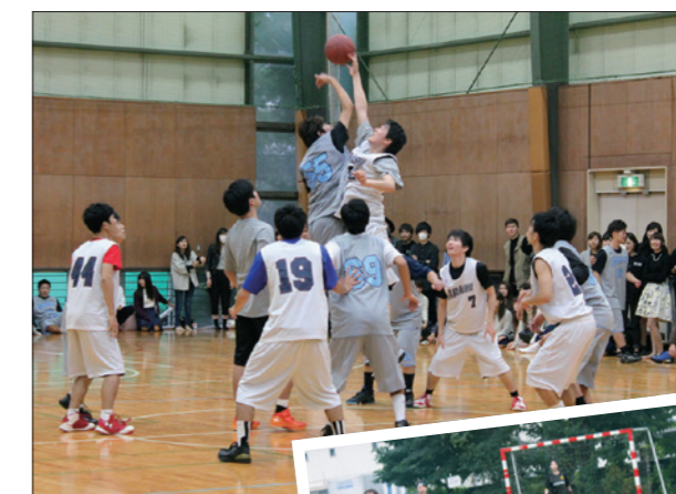
昨年の四大戦の様子▶▶

テニス男D女D混合D、 ソフトテニス男D女D混合D、サッカー、 軟式野球、フットサル女