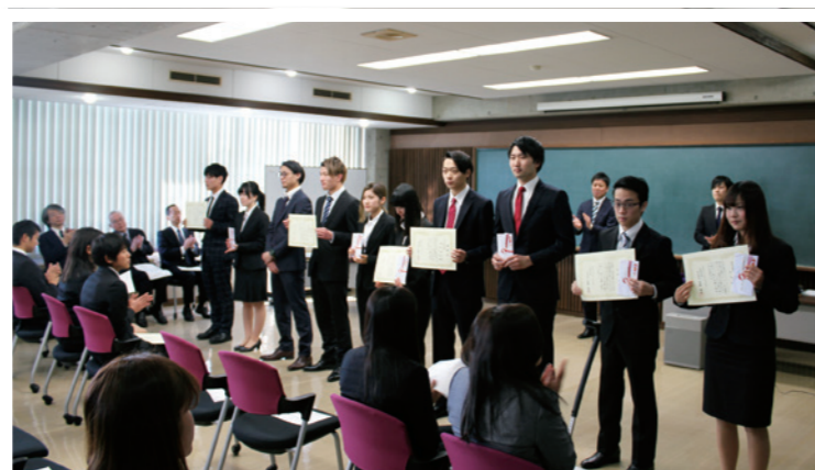
▲ 昨年度の表彰式の様子