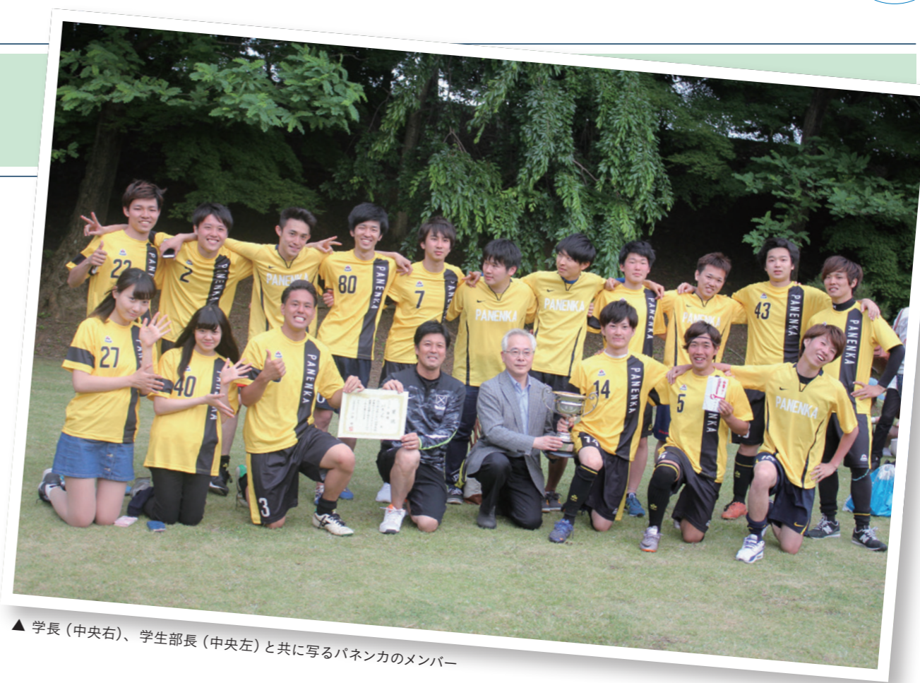
▲ 学長(中央右)、学生部長(中央左)と共に写るパネンカのメンバー