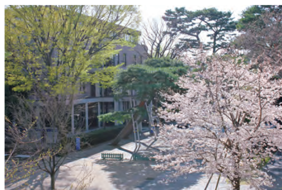
4月某日。色彩豊かな中庭の風景。