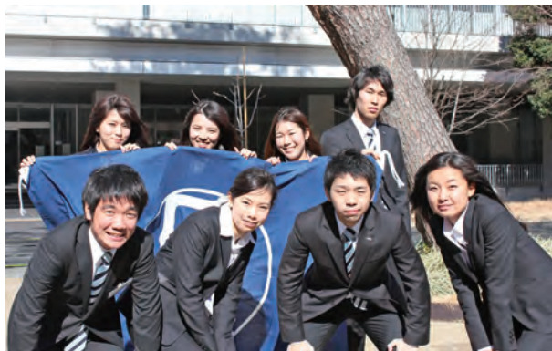
第 59 代成城大学体育部連合会本部幹部

新入生の皆様、ご入学おめでとうございます。入学された皆様は、大学生活という新しい環境への期待と不安を抱きながら、この冊子を手にとっていることと思います。