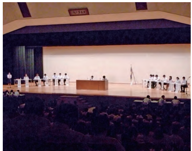
全学総会の様子。 各上部団体の総務などが登壇している。