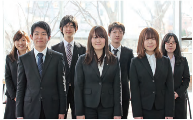
平成26年度文化部連合本部員