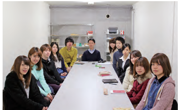
平成26年度総務会メンバー