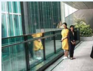
「月刊弁護士ドットコム」の表紙撮影風景

1978年北海道生まれ。2010年弁護士登録(現在の所属は多摩の森総合法律事務所)のほか、保護司も務める。弁護士としては主に国選事件の情状刑事弁護に注力しており、事件の背景にある問題(アルコールやギャンブル依存、人間関係依存など)に配慮し、依頼者に必要な支援やケアを提供することで根本的な紛争解決を目指し日々実践を行っている。