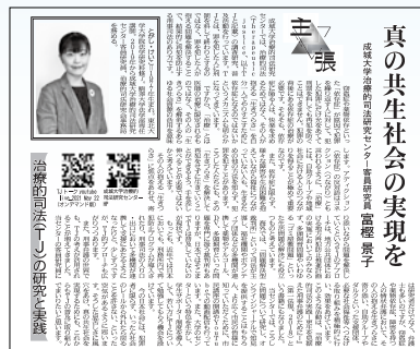
都政新報2021年6月15日号

1977年新潟県生まれ。博士(法学)。専門は刑法。東北大学法科大学院助教を経て現職。治療的司法(TJ)の実践に感銘を受け、刑事法理論との接続を研究し始めたばかり。共同研究者募集中。