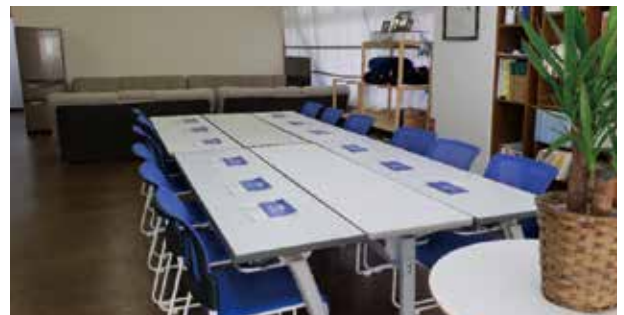
あるダルクのミーティングルームです。ミーティングで読み合わせするパンフレットが置かれています。NAの12ステップなどが書かれています。