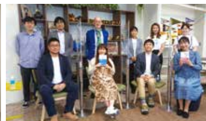
第1回配信 (2021年5月分) ゲストとスタッフ、学生サポーター