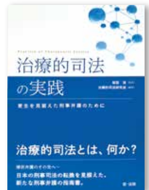
illustration by Yuki SUZUKI, design by Mayu