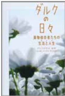
南保輔ほか(編) 「ダルクの日々— 薬物依存者たちの 生活と人生(ライフ)」 知玄舎(2014)