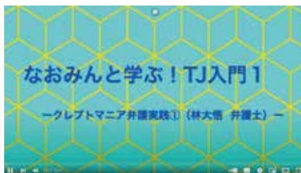
第1回配信 オープニング画面

当センターではTJに関する情報発信のためYouTube公式チャンネルを立ち上げました。立ち上げイベントは2021年5月22日に配信開始、同年7月からは月1回「なおみんと学ぶ! TJ入門」と題し、定期的にTJの実践を配信しています。