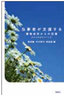
南保輔ほか(編) 「当事者が支援する— 薬物依存からの回復 ダルクの日々パート2」 春風社(2018)